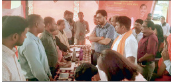
अभियान के तहत जागरूकता एवं लाभ परिपूर्ण शिविर के माध्यम से (आदिवासी) जनजातीय समुदाय के लोगों तक शासन की विभिन्न जनकल्याणकारी योजनाओं की जानकारी अंतिम पंक्ति तक पहुंचाने के साथ-साथ आधार कार्ड, जाति प्रमाण पत्र,

विकास विभाग महासमुंद के तत्वावधान में ग्राम पंचायत बागबाहरा कला के आश्रित ग्राम करमापटपर में आयोजित किया गया। ज्ञात हो कि बीते दिनों में विभिन्न समस्याओं के निराकरण हेतु प्रधानमंत्री नरेंद्र मोदी एवं मुख्यमंत्री छत्तीसगढ़ शासन विष्णु देव साय के नेतृत्व में सुशासन तिहार के रूप में आम जनमानस की समस्याओं, शिकायतों और मांगों को शिविर के माध्यम से सुना गया और संभवतः लगभग सभी मामलों का निराकरण संबंधित अधिकारी/कर्मचारी के पूर्ण सहयोग से निराकृत किया गया। इसी तारतम्य में पुनः नई सोच और नई ऊर्जा के साथ धरती आबा जनभागीदारी